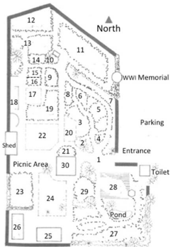
Washington Native Plant Society Garden

Western Washington Fruit Research Foundation Orchard