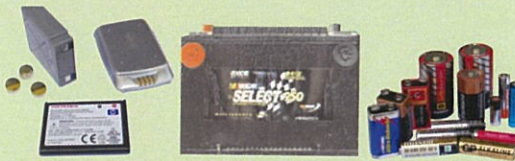
Baterías: domésticas y de automóviles