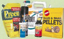
Productos para el patio y jardín