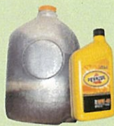
Aceite para motores