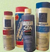
Suministros para piscinas y spa