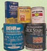
Pinturas y tinturas a base de aceite Sin látex