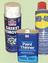
Diluyentes y otros disolventes