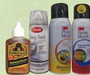
Colas y adhesivos